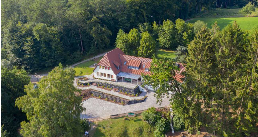
Foto: Thomas Haunhorst (Drohnenaufnahme, vor der Bautätigkeit erstellt).