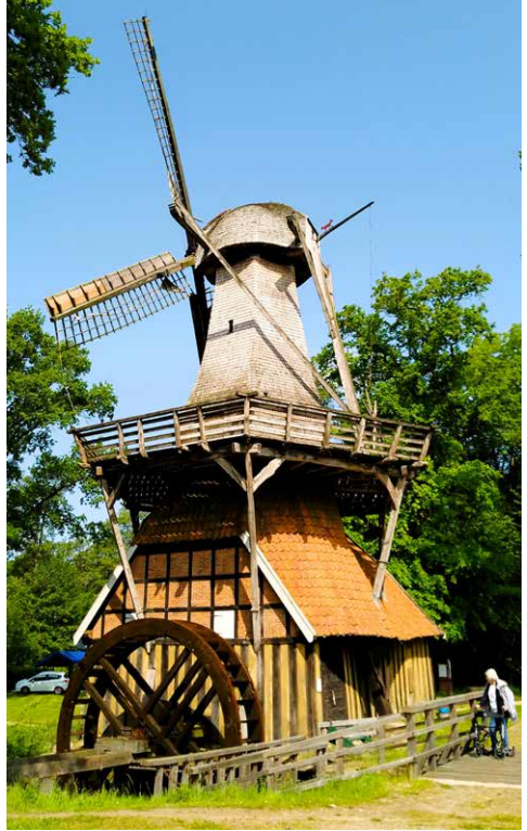
Die Hüvener Doppelmühle.

Der Verein zur Erhaltung der Gellenbecker Mühle e. V. veranstaltet am Sonntag, dem 13. Oktober, eine Besichtigungsfahrt zu bedeutenden historischen Mühlen in unserer weiteren Heimat. Besucht werden die Windmühle in Lechtingen, die Hüvener Mühle auf dem Hümmling, die eine Kombination aus Wasser- und Windmühle ist, und schließlich die Wassermühle Lage in der Grafschaft Bentheim, die noch Antriebstechnik aus dem 17. Jahrhundert besitzt und die Funktion einer Ölmühle zeigt. Zu diesem hochinteressanten Tagesausflug sind auch die Mitglieder des Heimatvereins Hagen a.T.W. herzlich eingeladen. Abfahrt ist um 9 Uhr bei der Gellenbecker Mühle. Zwischen Hüven und Lage wird eine Mittagspause in einem Restaurant eingeplant, die Teilnehmerkosten (ohne Essen) betragen 25 Euro. Anmeldungen bis spätestens 31. August unter »gerold-boelts@mail.de«.