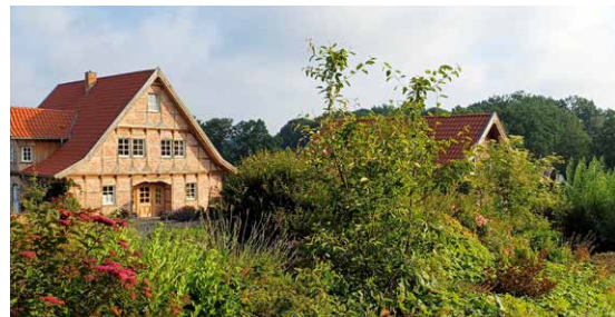
Das Foto zeigt den Ort der diesjährigen Pflanzaktion am 2. November: das Anwesen Gausmann an der Iburger Straße.

Die diesjährige Pflanzaktion findet wie jedes Jahr am ersten Samstag im November statt. In diesem Jahr werden Obstbäume auf dem Gelände des Anwesens Gausmann an der Iburger Straße 27 in Mentrup (in Richtung Bad Iburg hinter Kleinheider) angepflanzt. Mit der fachgerechten Anpflanzung von heimischen Obstgehölzen möchte der Heimatverein den Charakter von Streuobstwiesen bekannter machen und gleichzeitig an die Jahrhunderte alte Tradition des Obstanbaus in Hagen erinnern. Zur Mithilfe eingeladen sind alle Mitglieder und Freunde des Heimatvereins, gerne auch