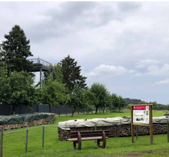
Ehemaliger Seilbahnturm im Hintergrund und der neue Infoplatz mit Ruhebänk auf der Großen Heide.

Eine neue Infotafel zur Hagerer Seilbahngeschichte wurde am Turm in der Großen Heide installiert. Eindrucksvolle Bilder aus den 60er-Jahren zeigen, was sich dort zu dieser Zeit abspielte. Eine zusätzliche Ruhebänk gibt der Anlage nun einen großen Aufenthaltswert. Der HVH bedankt sich herzlich beim Eigentümer des Grundstückes Winfried Seltmann.