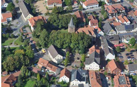
Hagen von oben.