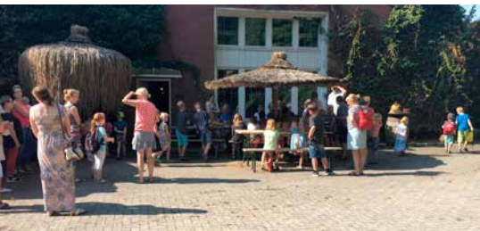
Ferienstpaß in der Töpferei Niehenke.

Der HVH unterstützt wieder die Ferienstpaßaktion und bietet Kindern im Alter von 5 bis 10 Jahren die Teilnahme an einem der fünf Kurse „Töpfern in der Töpferei Niehenke“ an. Nähere Informationen über die Seite https://www.ferienstpaß-hagen-atw.de/m/Events . Darüber ist auch die Anmeldung möglich.