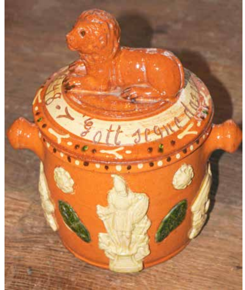
Neu im Töpfereimuseum: der Tabaktopf von 1948 aus der Werkstatt Hehemann.

Tabaktöpfe dienten der klimatisierenden Aufbewahrung des Pfeifentabaks und gehörten seit dem 18. Jahrhundert zu den Prestigeerzeugnissen der Töpfer. Sie wurden oft wohl nur auf Bestellung angefertigt und haben als „Familienstück“ in Schauschränken und Anrichten die Zeit überdauert. Der von der Familie Hehemann übergebene Tabaktopf zeichnet sich vor allem durch das sogenannte „aufgelegte Dekor“ aus. Seine Bestandteile wurden