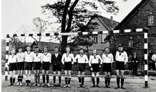
Die 1. Fußballmannschaft der DJK Gellenbeck im Jahr 1931 auf dem neuen Sportplatz beim Hof Meyer zu Gellenbeck.

Dr. Hermann Queckenstedt, Historiker und Direktor des Diözesanmuseums Osnabrück, erläutert an diesem Abend die Hintergründe und das bundesweite Wirken dieses katholischen Sportverbandes. Queckenstedt, der von 2014 bis 2017 auch Präsident des VFL Osnabrück war, nimmt hierbei insbesondere auch die lokale DJK-Sportbewegung bis hin zur Gründung der Sportvereine in Ober- und Niedermark in den Blick. DJK steht für „Deutsche Jugendkraft“. Dieser 1920 gegründete Verband fasste die seit dem 19. Jahrhundert aus der katho-