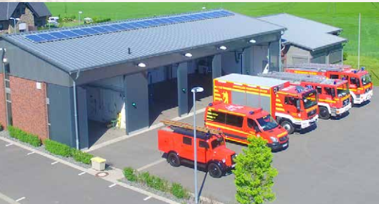
Das 2014 erbaute Feuerwehrgerätehaus.

Besichtigung des Feuerwehrgerätehauses und Information über die Arbeit der Freiwilligen Feuerwehr.