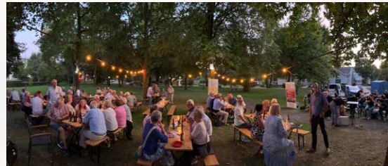
Sommerfest 2025.

Sommerfest mit Speisen vom Grill, kühlen Getränken, musikalischer Unterhaltung und Illumination bei einbrechender Dunkelheit.