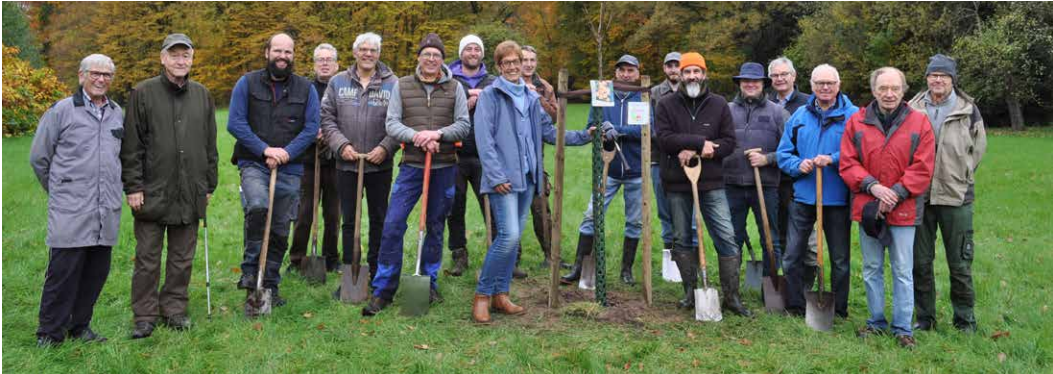
Das Team am Mirabellenbaum.

Der Heimatverein hat zusammen mit der AG Natur + Umwelt auf dem Areal der Familie Gausmann an der Natruper Straße eine Streuobstwiese mit zehn Bäumen angelegt. Es handelt sich ausschließlich um alte und standortgerechte Sorten. Von der Baumschule Schönhoff orderte der Verein Birnen-, Zwetschgen-, Kirsch-, Mirabel-